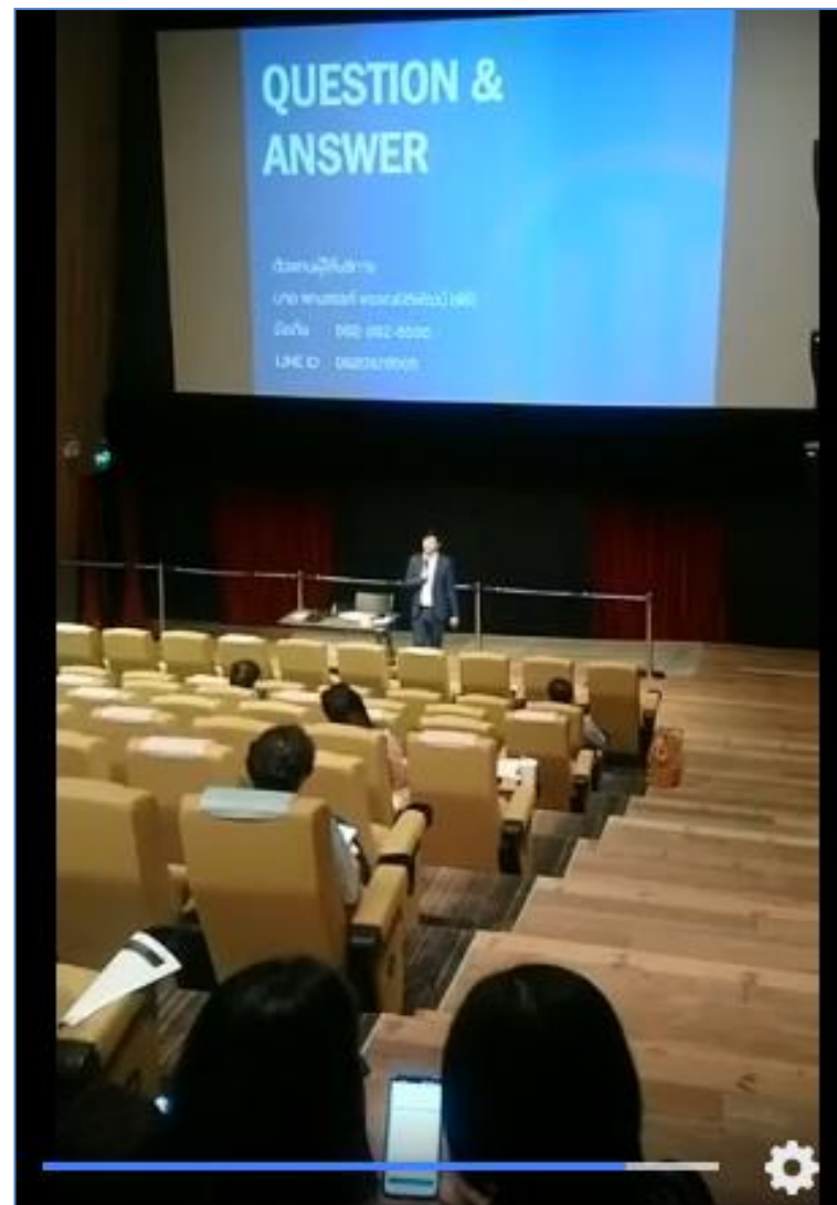
๔. กิจกรรมเสริมสร้างวัฒนธรรมองค์กร งานพัฒนาบุคลากรหอภาพยนตร์สัมพันธ์