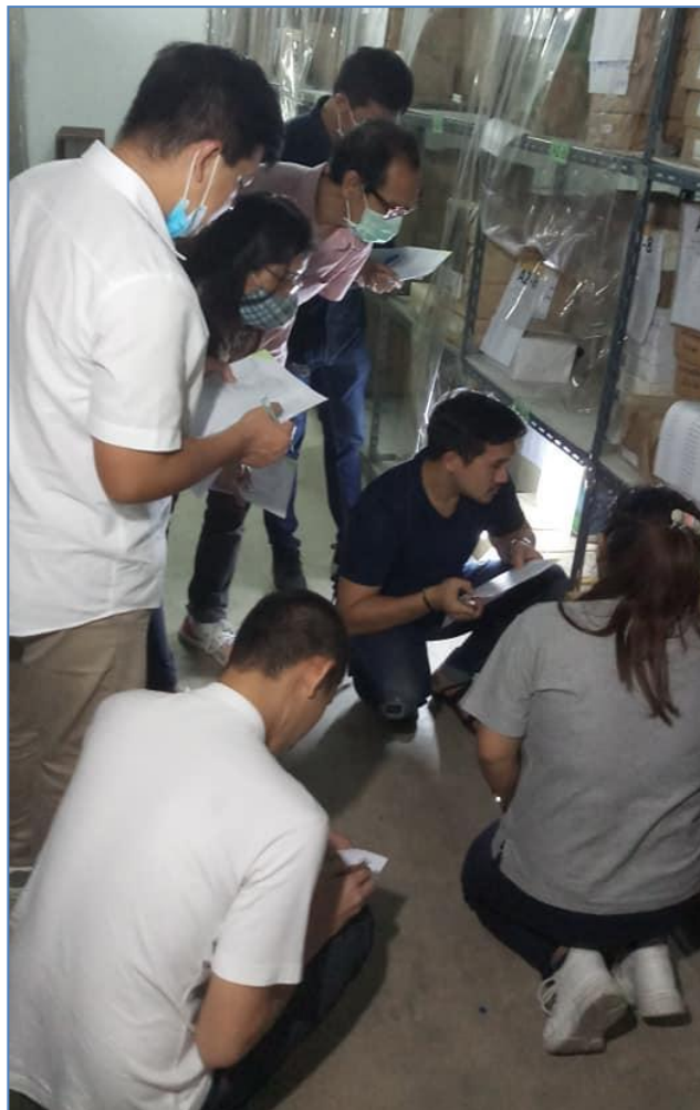
๖. การดำเนินงานของคณะกรรมการตรวจนับครุภัณฑ์ ประจำปี ๖๓